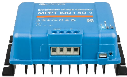
Контроллер заряда SmartSolar MPPT 100/50