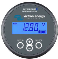
Bluetooth считывание BMW-712 Smart Battery Monitor