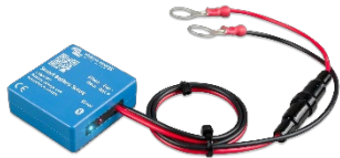
Bluetooth считывание Smart Battery Sense